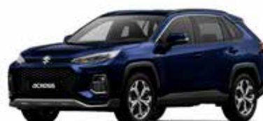
Dark Blue Mica (8X8)