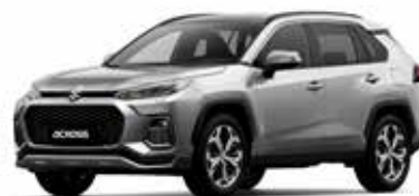
Silver Metallic (1D6)