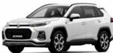
White Pearl Crystal Shine (070)