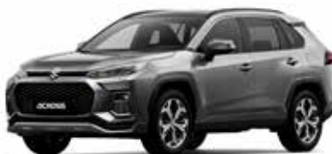
Gray Metallic (1G3)