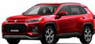
Sensual Red Mica (3T3)