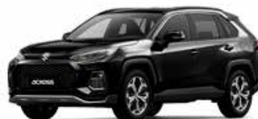
Attitude Black Mica (218)